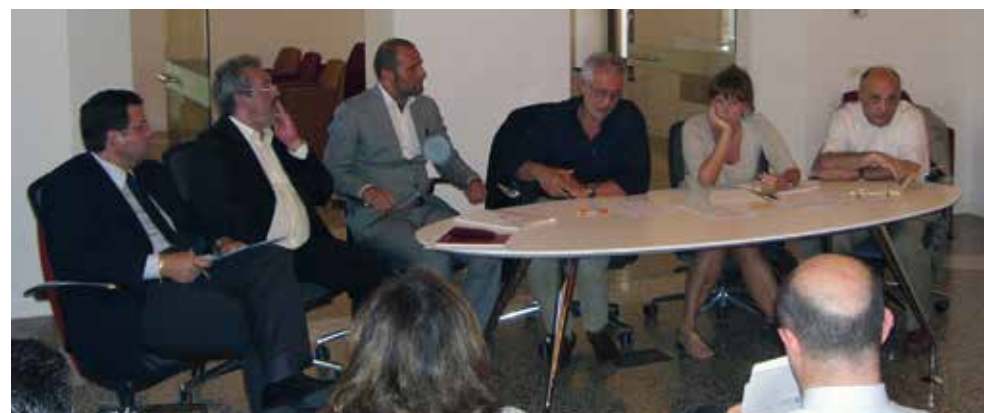
Martignacco, 16 luglio 2009 - Incontro con l'Assessore regionale Alessia Rosolen e i Sindaci di Martignacco e Precenico a sostegno dei lavoratori della Safilo

Quando la crisi economica colpisce anche il nostro territorio, ANCI FVG si attiva con i massimi vertici della Regione confrontandosi più volte con l'allora Assessore regionale al Lavoro Alessia Rosolen per coordinare iniziative di sostegno nei confronti dei lavoratori dei Comuni del Friuli Venezia Giulia più colpiti.