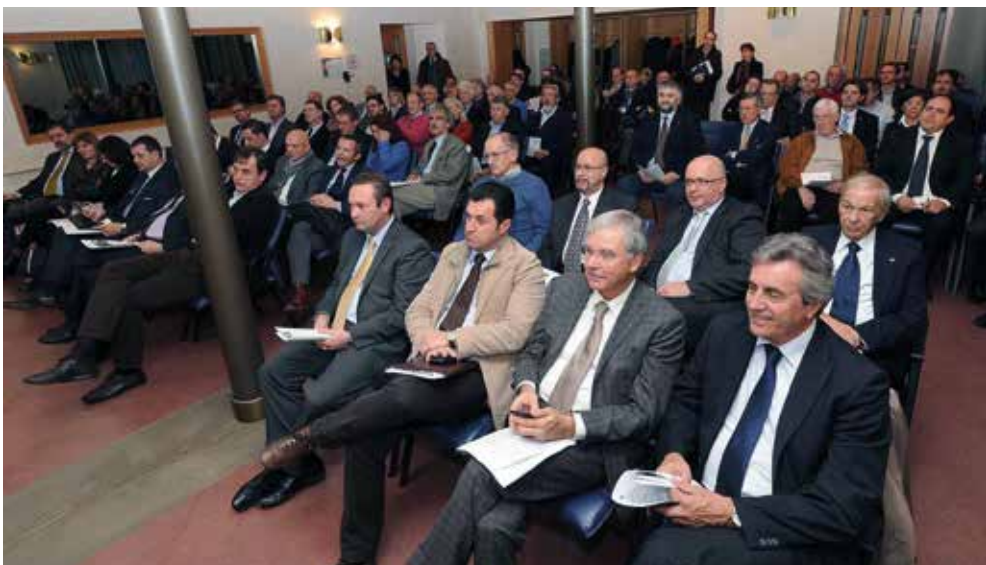
Amministratori locali all'Assemblea regionale convocata presso la Fondazione CRUP di Udine il 14 novembre 2012