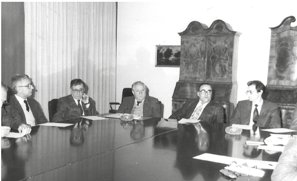
Tavoli di confronto istituzionale

In quegli anni ANCI FVG si preoccupa di instaurare da subito un rapporto diretto con il Consiglio e la Giunta regionale per l'approvazione di leggi che diano maggiore autonomia ai Comuni sia in termini normativi che finanziari.