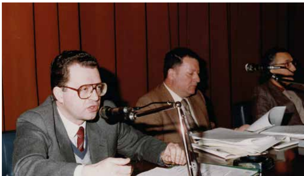
Con Ciuffarin si registra l'adesione all'ANCI FVG di tutti gli allora 219 Comuni della Regione, esempio unico in Italia.

I temi principali di interesse per i Comuni in quel periodo sono di natura finanziaria: la Legge Stammati e il vaglio dei bilanci pubblici.