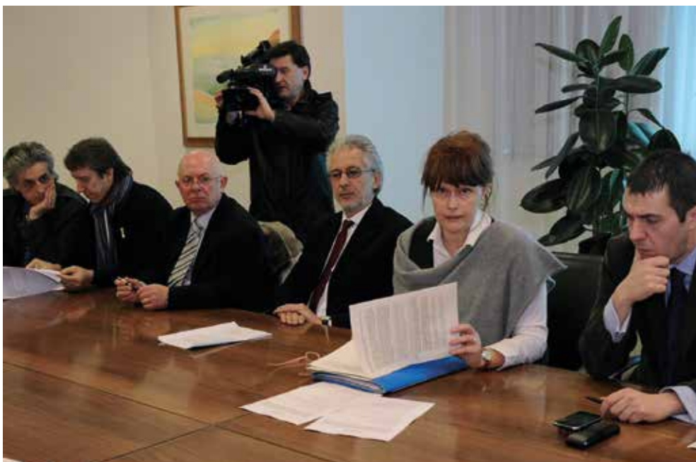
Udine, 1 marzo 2010 - Regione FVG, ANCI FVG, UPI FVG, Sindacati e Banche siglano un accordo per valorizzare e promuovere il sostegno al credito per i lavoratori precari