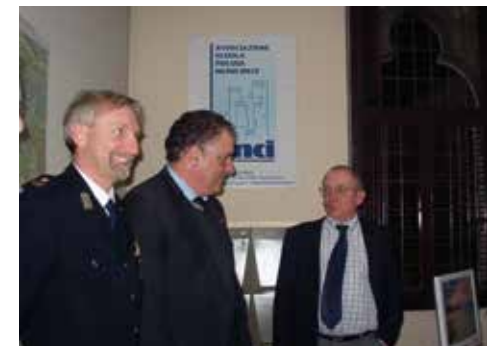
Alcuni momenti dell'inaugurazione della sede dell'Associazione Scuola di Polizia municipale del FVG ospitata nella sede dell'ANCI FVG a Udine