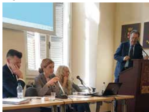
A Roma il 27 marzo 2019 il Presidente Pezzetta interviene nel corso del Consiglio nazionale dell'ANCI