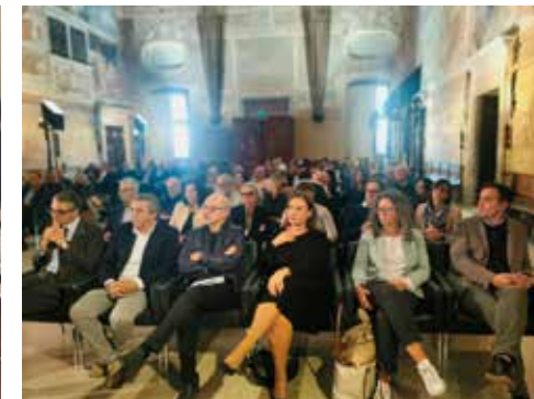
Il congresso regionale del 9 ottobre 2024