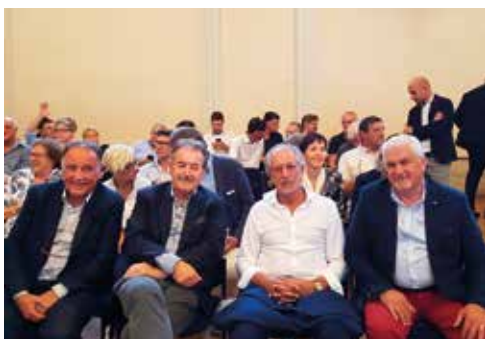
A fine mandato, nel settembre 2019, Pezzetta - con i già Presidenti Pizzolitto e Pertoldi e con il Presidente di Fedesantità ANCI FVG, Napoli - partecipa all'Assemblea congressuale che elegge Favot alla guida dell'ANCI FVG