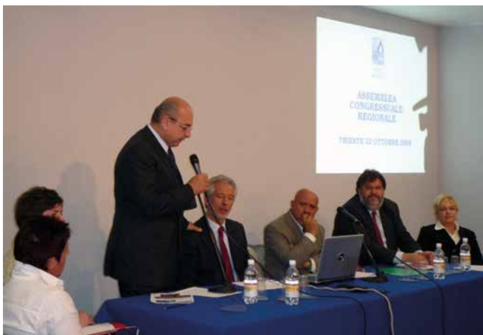
Il saluto del Sindaco di Trieste Roberto Dipiazza

Gianfranco Pizzolitto che è Sindaco di Monfalcone viene eletto Presidente dell'ANCI FVG a Gorizia l'11 febbraio 2005. L'Assemblea congressuale regionale del 22 ottobre 2008 a Trieste lo riconferma.