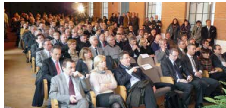
Autorità e Amministratori presenti all'Assemblea di Palmanova del marzo 2013