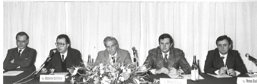
Villa Manin di Passariano, 19 dicembre 1987 - L'intervento del Presidente Giannino Ciuffarin, in apertura dei lavori del convegno