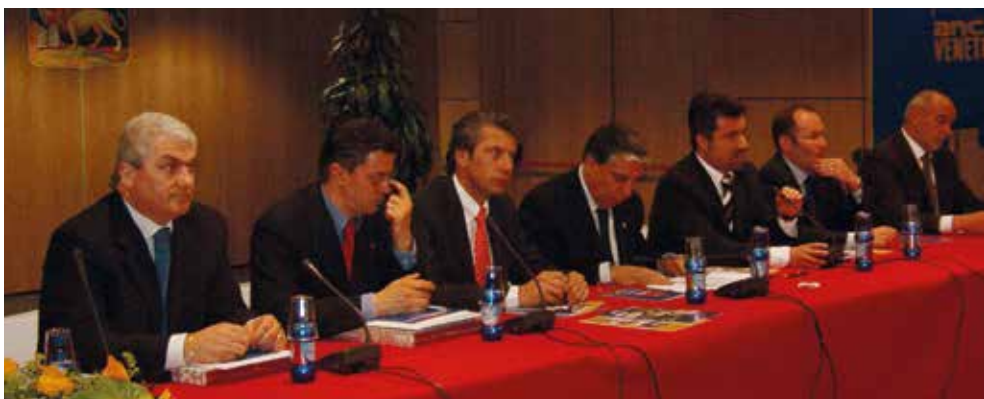
Venezia, 14 aprile 2004 - Il Presidente Flavio Pertoldi all'evento "Dire & Fare nel Nord Est" organizzato in collaborazione con ANCI Veneto

ANCI FVG decide di partecipare alla società costituita da ANCI Veneto, ANCI SA, che nel corso del 2000 realizza la prima rassegna "Dire & Fare nel Nord Est" nel corso della quale le PA del triveneto presentano i propri progetti innovativi per la gestione dei servizi. La rassegna, ospitata prima a Rovigo e poi a Venezia si è ripetuta fino al 2014.