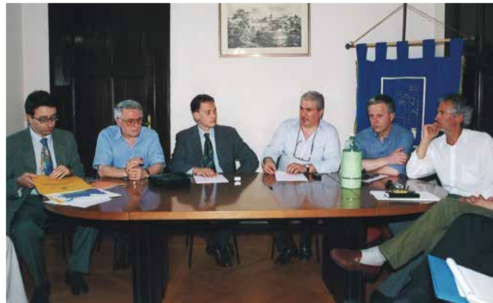
Udine, 19 giugno 2002 - L'Assessore regionale alle Autonomie Locali Luca Ciriani incontra il Comitato esecutivo di ANCI FVG Da sinistra: Muradore, Ciriani, Pertoldi, Cuzzi e Pizzolitto

Sono anni che vedono l'ANCI FVG alle prese con vari temi: sullo sfondo la preoccupazione per la diminuzione delle risorse finanziarie.