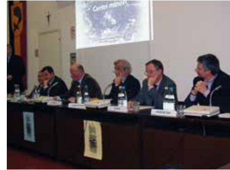
Nel 2017 a Trasaghis si tiene un'iniziativa, d'intesa con la sede nazionale, dedicata ai centri minori

ANCI FVG ha sempre mantenuta viva l'attenzione per le problematiche dei Comuni minori, con incontri, iniziative e riunioni della Consulta dei piccoli Comuni.