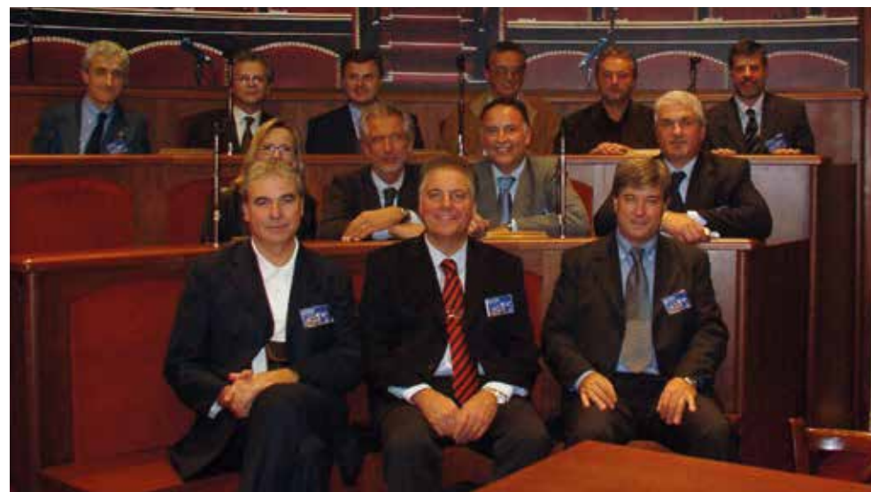
Il Presidente Pertoldi e la delegazione di Amministratori locali del FVG all'Assemblea nazionale di Genova nel 2004

L'attività regionale prosegue sempre in sinergia con la sede nazionale vedendo, negli anni, gli Amministratori locali della Regione presenti anche alle iniziative organizzate nel resto d'Italia.