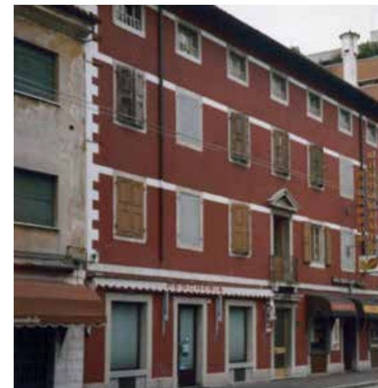
Viale Volontari della Libertà

Dal 1985 la sede diventa quella di Piazza XX Settembre.