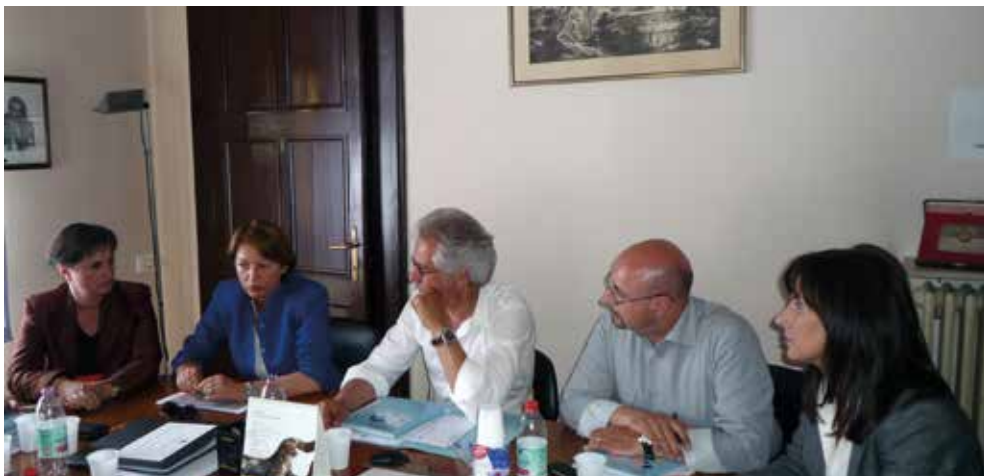
Udine, 20 maggio 2009 - Il Magnifico Rettore dell'Università degli Studi di Udine, Cristiana Compagno, nella sede dell'ANCI FVG

Per provare a superare la situazione di crisi, l'ANCI FVG incontra più volte anche le OO.SS. e costituisce un gruppo di lavoro con l'Università degli Studi di Udine per rendere più competitivo il territorio, investendo nel capitale umano.