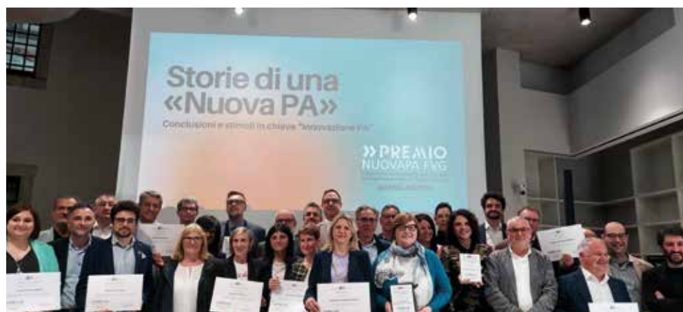
Le esperienze protagoniste della seconda edizione del Premio NUOVAPA FVG premiate il 9 aprile 2024 a Udine

Per offrire il necessario supporto ai Comuni della Regione nell'attuazione degli obiettivi del PNRR (DNSH E ReGiS) nel marzo 2023 ANCI FVG sigla un protocollo d'intesa con la Regione FVG e la Ragioneria Territoriale dello Stato.