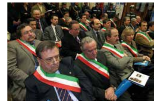
Un primo piano di alcuni dei Sindaci della Regione in sala a Villa Manin