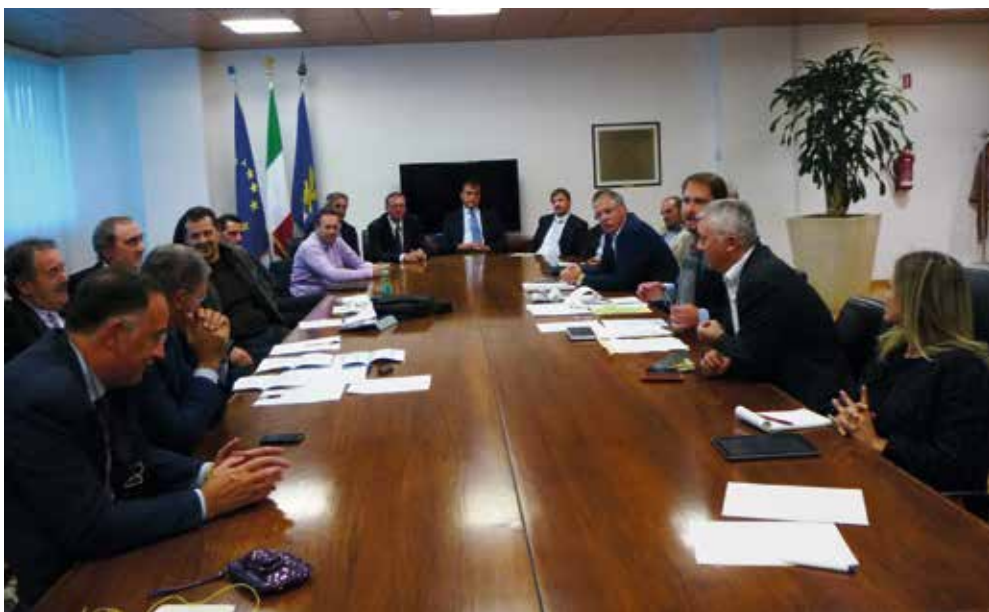
Il 4 ottobre 2013 in Regione a Udine un incontro con i Capigruppo in Consiglio regionale