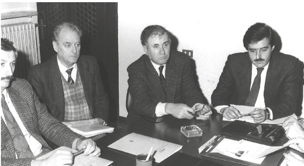
Tavoli di confronto istituzionale

In quegli anni ANCI FVG si preoccupa di instaurare da subito un rapporto diretto con il Consiglio e la Giunta regionale per l'approvazione di leggi che diano maggiore autonomia ai Comuni sia in termini normativi che finanziari.