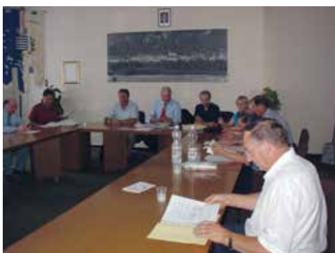
San Daniele del Friuli