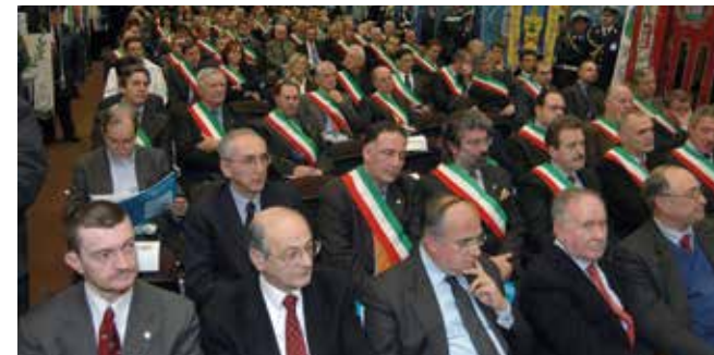
Autorità e Amministratori locali nella sala convegni di Villa Manin di Passariano