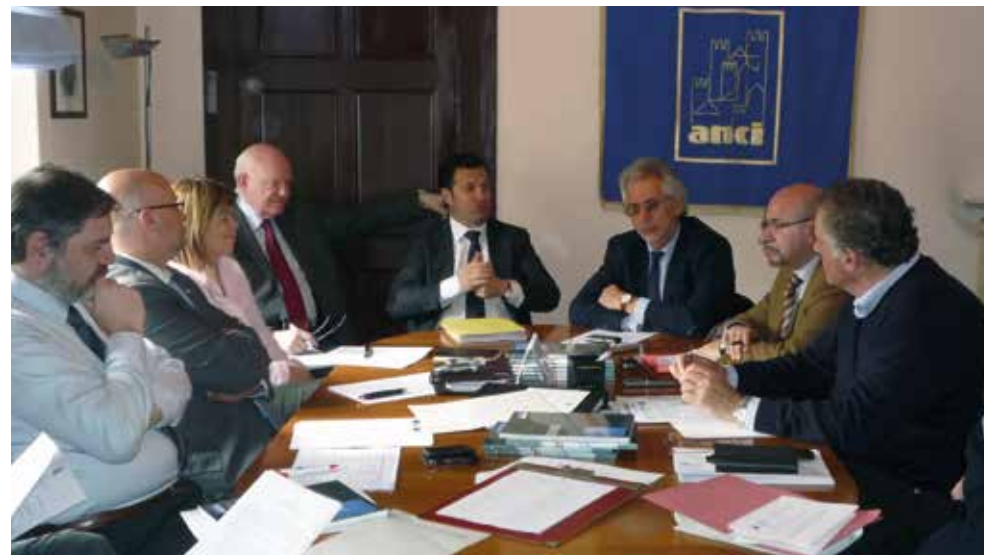
Udine, 24 marzo 2010 - Il Comitato esecutivo di ANCI FVG incontra Franco Iacop che è Consigliere regionale e primo firmatario della proposta di legge su "Il Segretario degli Enti locali del Friuli V.G."

Viene avviato un tavolo di lavoro Regione, ANCI e UPI in tema di contributi allo sport. Analogo metodo viene adottato per rendere ancora più efficace la "legge anticrisi" per quanto riguarda le opere pubbliche e il prezzario regionale.