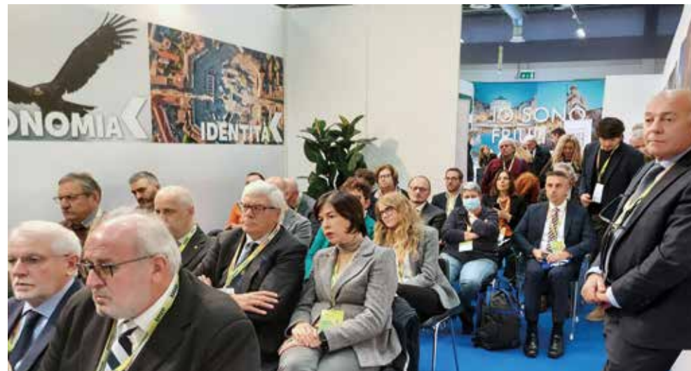
Gli Amministratori locali presenti alle iniziative di approfondimento organizzate nello stand della Regione FVG alla 39 a Assemblea nazionale ANCI a Bergamo

La collaborazione fra Regione e ANCI FVG si rinnova anche nel 2023 con uno spazio espositivo comune e iniziative di approfondimento alla 40 a Assemblea nazionale a Genova.