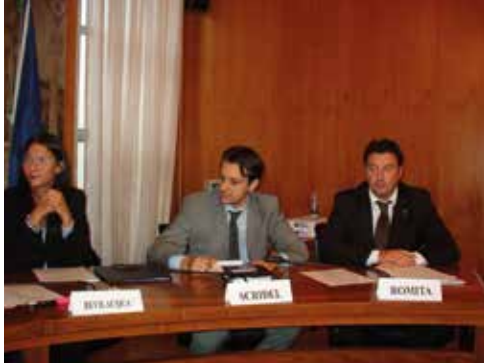
Codroipo, 4 ottobre 2006 - Riunione di una delegazione di giovani Amministratori del FVG

Tra gli incontri e le iniziative dedicate ai giovani Amministratori dell'ANCI, vengono organizzati momenti di confronto anche sul territorio e l'Assemblea nazionale del 15 e 16 aprile 2016 a Trieste.