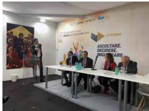
A fine novembre 2019 il neo Presidente Favot interviene ai lavori dell'Assemblea nazionale ANCI di Arezzo