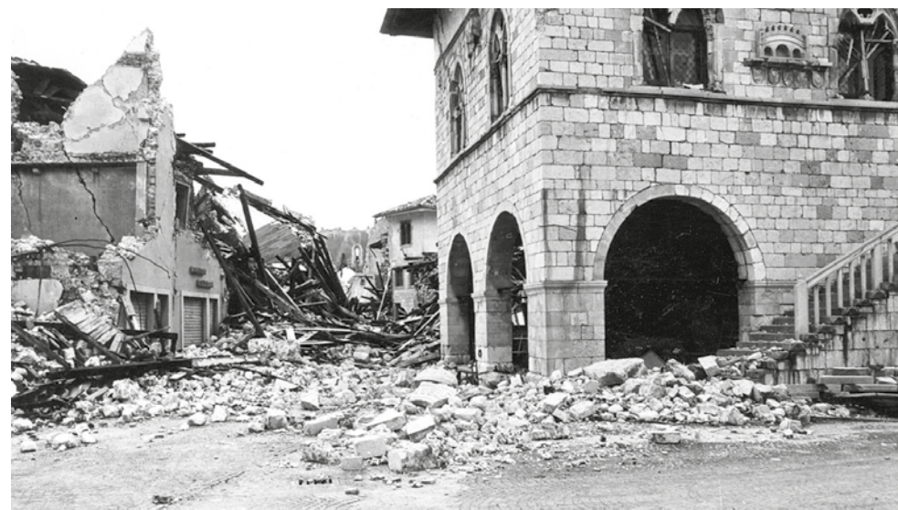
La devastazione dopo il terremoto del 6 maggio 1976

Sono anni nei quali ANCI FVG svolge un ruolo di primo piano nella formazione della legislazione regionale, nella definizione del piano urbanistico regionale, nell'impostazione del piano regionale di sviluppo, nella proposizione complessiva per la soluzione dei problemi delle zone terremotate e nella prospettazione dell'assetto territoriale e dell'organizzazione dei servizi sociali in tutta la Regione.