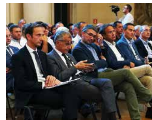
Il saluto del Presidente della Regione Friuli Venezia Giulia, Massimiliano Fedriga e le Autorità e gli Amministratori locali presenti in sala il 5 settembre 2019