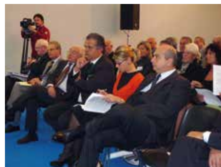
Autorità e Amministratori locali in sala il 22 ottobre 2008

In quei giorni, dal 22 al 25 ottobre 2008 a Trieste, il Friuli Venezia Giulia ospita per la prima volta la XXV Assemblea nazionale ANCI.