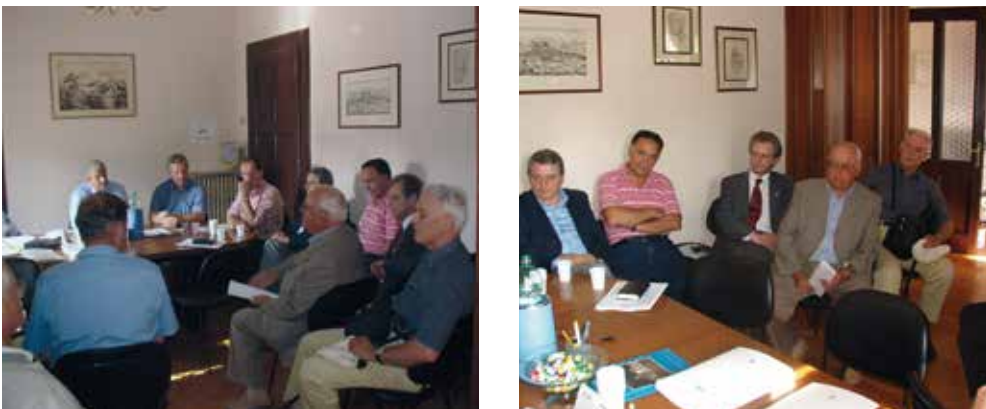
A Udine nel settembre 2004 un incontro con una delegazione di già Sindaci del FVG

Con l'Associazione dei già Sindaci del Friuli Venezia Giulia