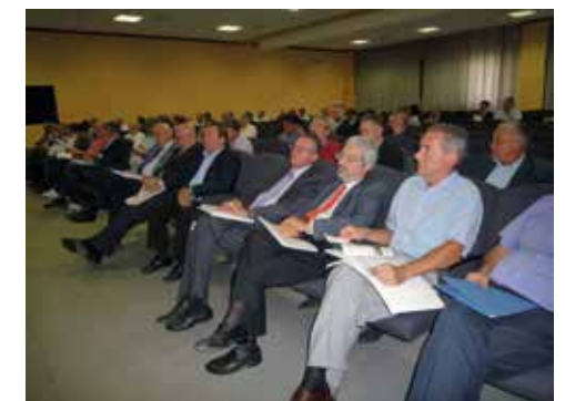
Gli Amministratori locali in sala