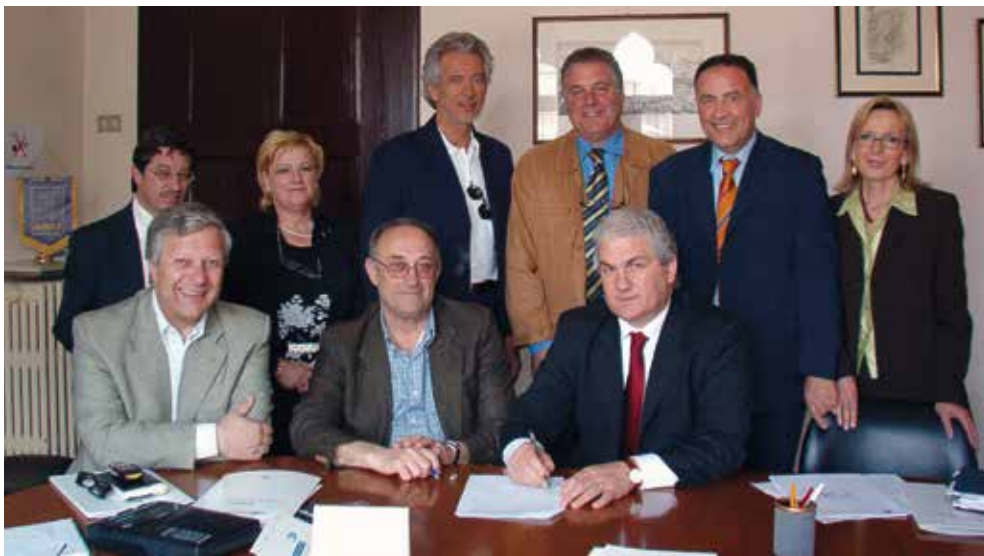
Nel maggio del 2004 viene siglato l'accordo ANCI FVG - FISM (Federazione italiana scuole materne)

Non mancano le iniziative sui temi della scuola e del welfare