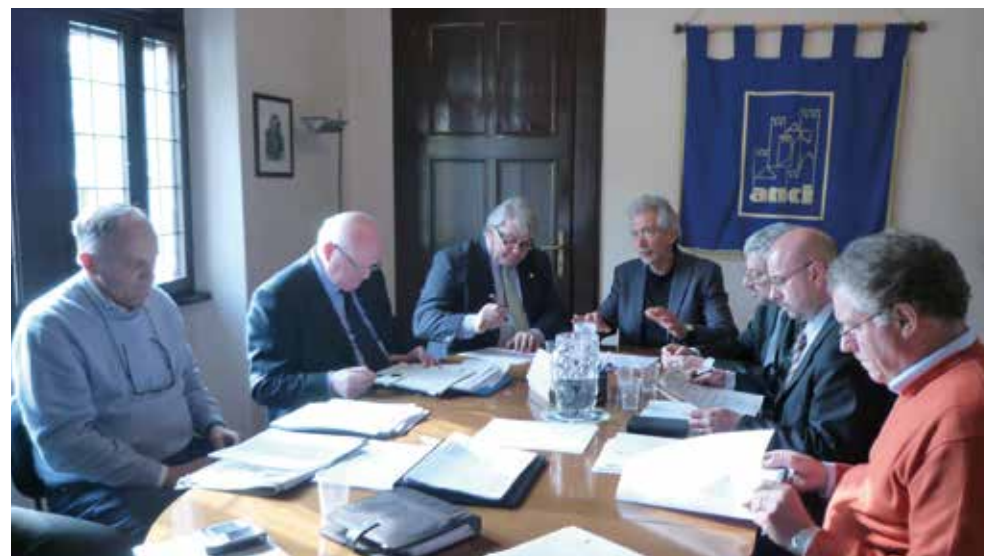
Udine, 21 aprile 2010 - Il Comitato esecutivo di ANCI FVG incontra l'Assessore regionale Elio De Anna

Viene avviato un tavolo di lavoro Regione, ANCI e UPI in tema di contributi allo sport. Analogo metodo viene adottato per rendere ancora più efficace la "legge anticrisi" per quanto riguarda le opere pubbliche e il prezzario regionale.