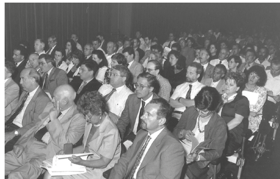
Affollata assemblea di Sindaci a Villa Manin di Passariano Puntin e Amirante

Viene approvata la Legge costituzionale 2/1993 che attribuisce alla Regione Friuli Venezia Giulia competenza primaria in materia di Enti locali.