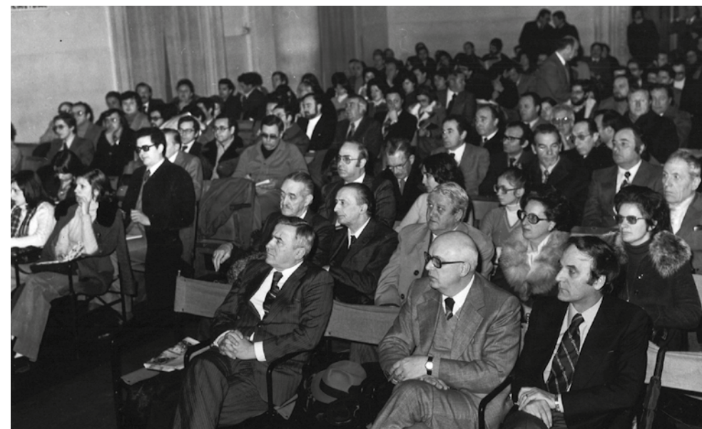
Assemblea di ANCI FVG

Vengono stabiliti criteri nuovi per la ripartizione delle risorse per avviare la perequazione tra i contratti dei vari Enti.