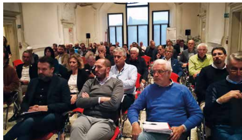
Gli Amministratori locali in sala a Spilimbergo