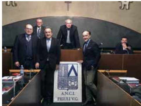
Gemona del Friuli dove la Scuola Mosaicisti del Friuli dona una rappresentazione del logo associativo