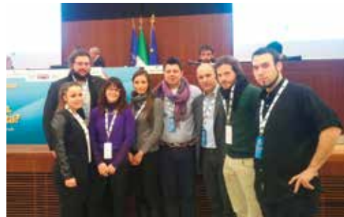
A Milano il 20 febbraio 2015 una delegazione del FVG partecipa all'Assemblea nazionale dei giovani Amministratori