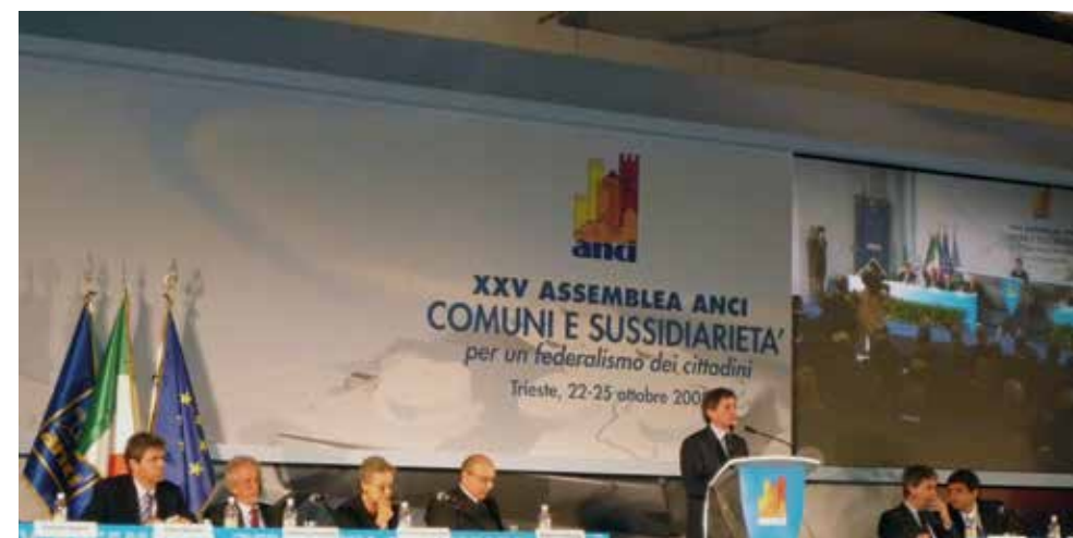
Il Sindaco di Roma, Gianni Alemanno, apre i lavori della XXV Assemblea nazionale ANCI a Trieste

In quei giorni, dal 22 al 25 ottobre 2008 a Trieste, il Friuli Venezia Giulia ospita per la prima volta la XXV Assemblea nazionale ANCI.