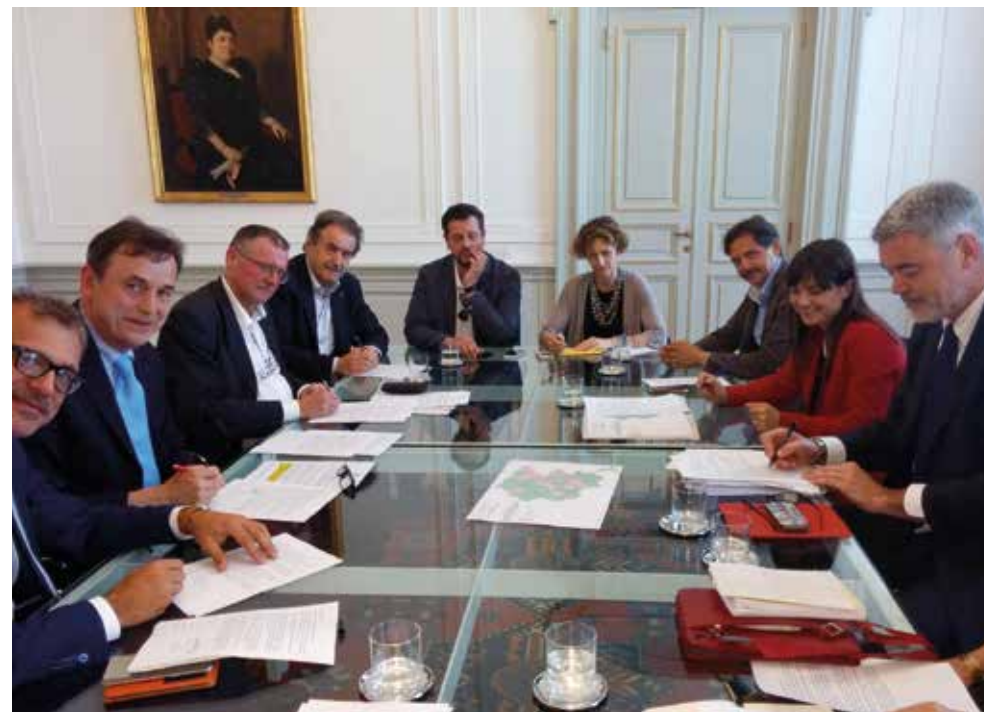
Trieste, 21 giugno 2016 - Trattativa sulle UTI

Ritiene che altre funzioni debbano essere svolte nel rispetto del principio di adeguatezza e quindi declinate o per singolo Comune o per ambito e che l'adeguatezza stessa vada individuata attraverso criteri oggettivi e concertati e, sulla scorta di quanto avviene in altre realtà di autonomia avanzata, utilizzando parametri di efficienza e di efficacia nonché di sostenibilità dei servizi.