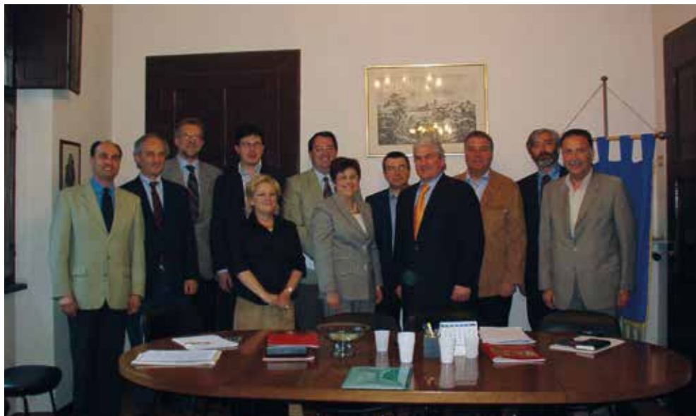
Udine, 14 maggio 2003 - L'incontro per la sottoscrizione del protocollo d'intesa tra ANCI FVG e ANCREL FVG

Con l'ANCREL (Associazione nazionale Certificatori e Revisori degli Enti locali)