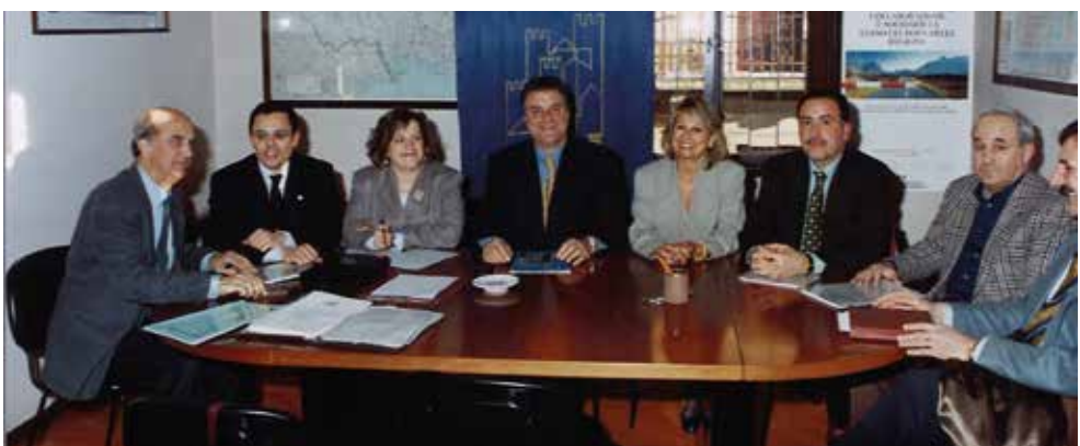
Momenti di confronto con Autorità nazionali e regionali

Federsanità ANCI FVG diventa la "sede" privilegiata di un dialogo propositivo tra amministratori comunali, direttori generali delle Aziende sanitarie territoriali ed ospedaliere e soggetti attuatori delle politiche regionali in materia socio sanitaria.