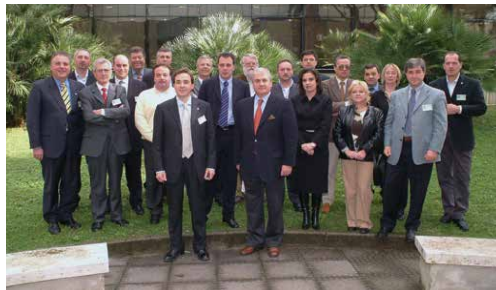
Napoli, 5 settembre 2003 - Il Presidente Pertoldi guida la delegazione di Amministratori locali del FVG all'Assemblea nazionale ANCI

L'attività regionale prosegue sempre in sinergia con la sede nazionale vedendo, negli anni, gli Amministratori locali della Regione presenti anche alle iniziative organizzate nel resto d'Italia.