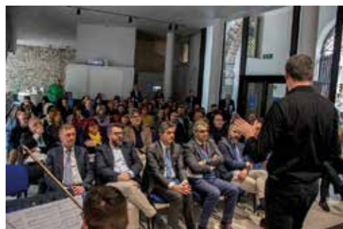
Stakeholder e rappresentanti dei Comuni in sala